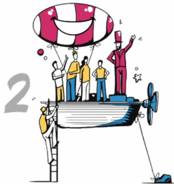
2 LES SÉMINAIRES, RÉCEPTIONS ET TEAM-BUILDING D'ENTREPRISE