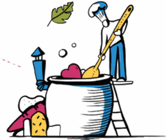
3 PÔLE RESTAURATION GRAND PUBLIC ET ÉVÈNEMENTIELLE