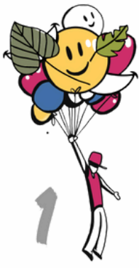
1 LE LOISIR GRAND PUBLIC